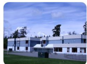
David Cameron Elementary School