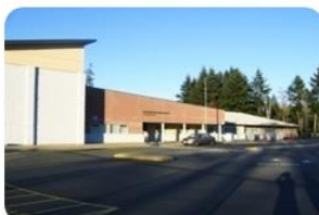
Colwood Elementary School

학교 명 Belmont High School 설립연도 1955년 학 년 7 th ~ 12 th 학생 수 1200 여명 웹 사이트 www.bhs.vic.edu.au