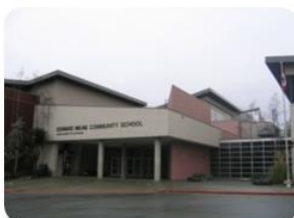
Edward Milne Community School