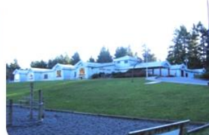
Hans Hegelsen Elementary