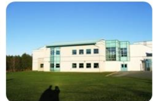
Journey Middle School