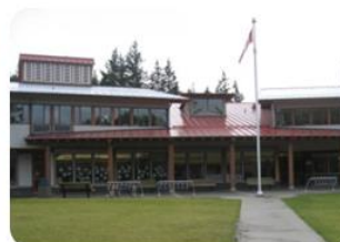
Happy Valley Elementary