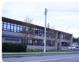
Ruth King Elementary School