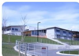
John Stubbs Elementary Middle School